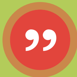
Helena, SPP Fonder